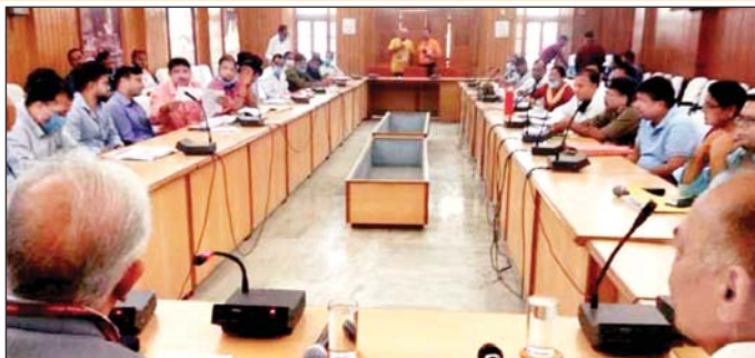
अधिकारियों की बैठक लेते आपदा प्रबंधन प्राधिकरण के सदस्य।

उन्होंने कहा कि मानसून को देखते हुए आपातकालीन आपदा प्रबंधन टीम को भी अलर्ट पर रखा जाए और साथ ही मानसून से संबंधित अपडेट लेते रहे। इसके साथ ही राज्य की आर्थिक व्यवस्था में सुधार किए